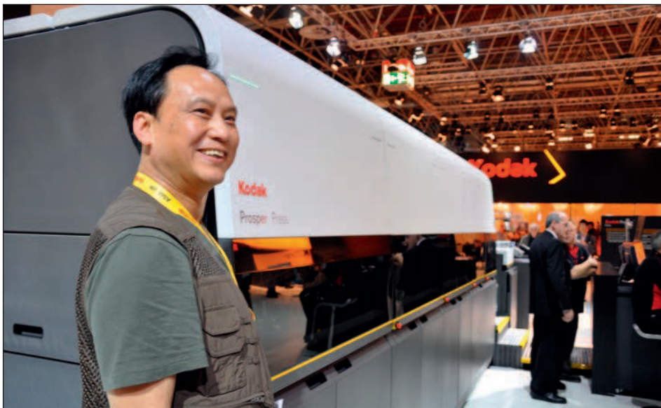
A Jiangxi Xinhua Printing Co. Ltd az idei drupán vásárolt meg egy Kodak Prosper 5000 XL nyomógépet

Összességében az mondható, hogy a kínai nyomdaipar már most is jelentős kapacitásokkal rendelkezik, és az utóbbi években a kínai nyomdaipari beszállító cégek is erőteljesen nyomulni kezdtek a külső piacok felé. A következő években így erősödő kínai nyomdaipari jelenléttel lehet számolni Európában is.