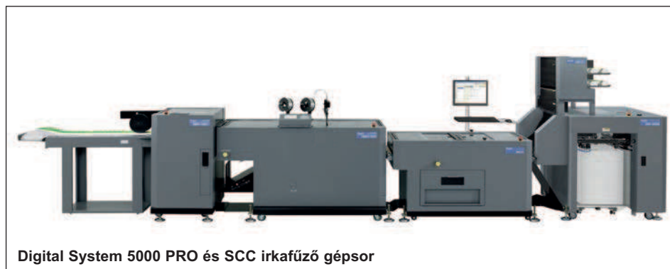
Digital System 5000 PRO és SCC irkakészítő gépsor

Kiválóan alkalmas digitális és ofsetteljárásal nyomtatott termékek ragasztókötéséhez. A felületkezelt, mázolt nyomathordozók kötése sem okoz problémát, valamint nem érzékeny a digitális termékeknél gyakran alkalmazott szilikonolajra sem. A könyvekhez szükséges borítók bígelését is elvégzi. A szükséges beállítások teljesen automatizáltak történnek. Jól alkalmazható fényképalbumok, kezelési utasítások és jegyzetek készítéséhez.