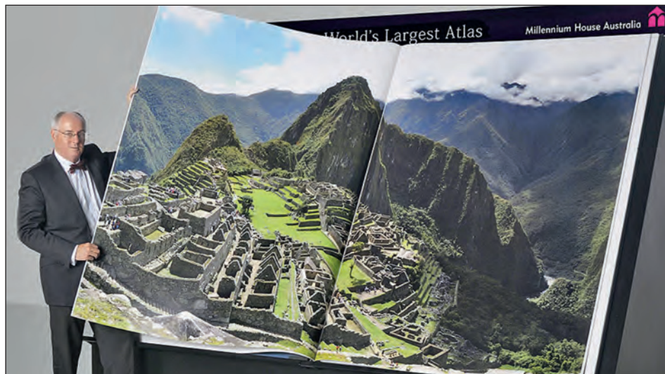
A világ legnagyobb atlaszát (Earth Platinum; 1,80 x 2,75 m; Millennium House, 2012) az ausztrál Lithorama nyomdában egy KBA Rapida 205 íves ofszetgépen nyomtatták