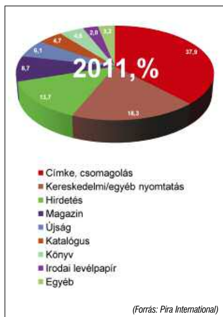
A 2011-ben 791 milliárd értékű nyomtatási világpiac megoszlása termékcsoportonként

nyomtatásnál kismértékű növekedést, a heat-set és a coldset nyomtatásnál jelentős, a szitanyomtatásnál pedig kismértékű csökkenést prognosztizálnak.